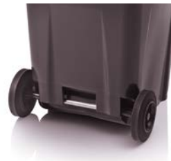
Räder Ø 250 mm