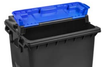
Deckel im Deckel