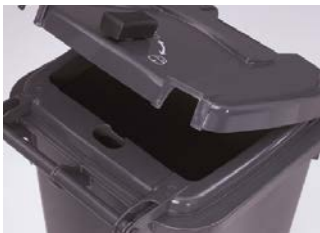
Deckel beidseitig zu öffnen